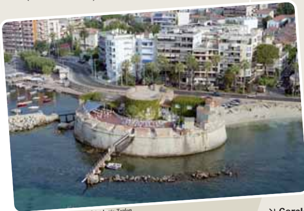
© Cercle de la Bdd, Fort Saint-Louis, Toulon