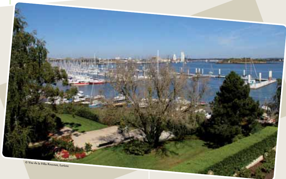
© Vue de la Villa Kerozen, Lorient