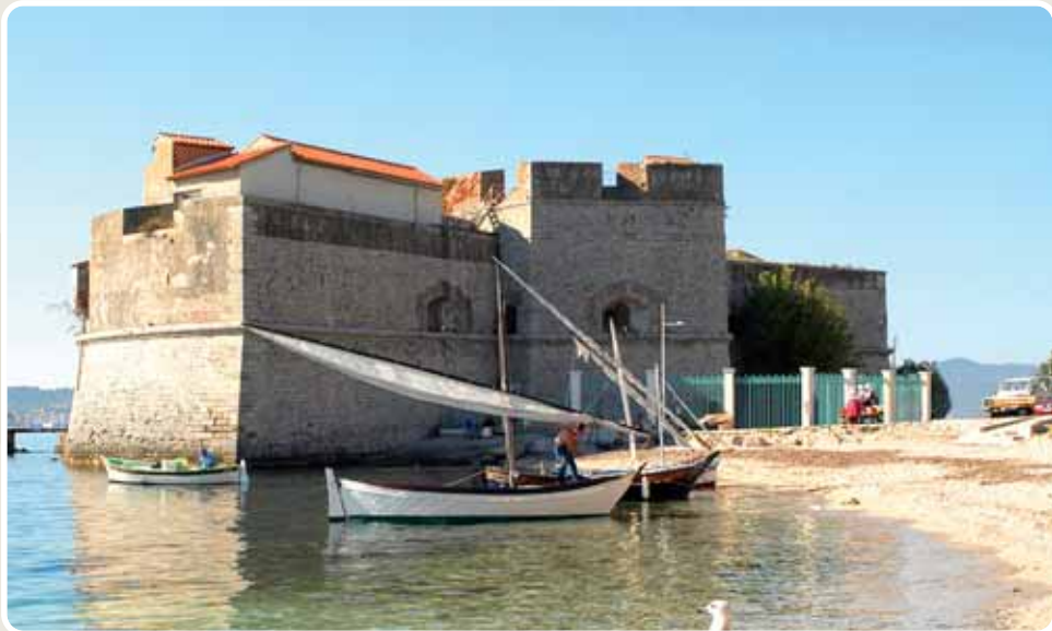
© Cercle de la BdD, Fort Saint-Louis, Toulon