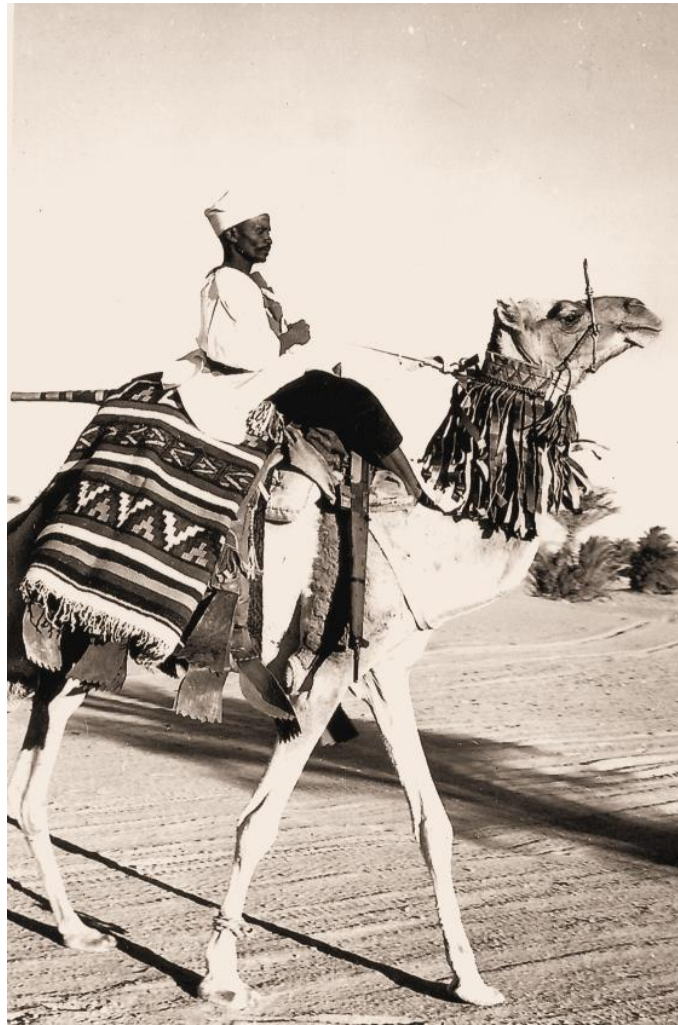
Un méhariste toubou en grande tenue