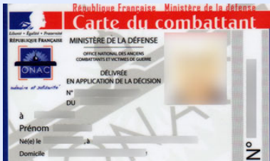
Exemple de carte du combattant

Dans le courant de l'année, 5 commissions nationales d'attribution des cartes de combattants et titres de reconnaissance de la Nation se sont tenues : 287 cartes et 368 TRN ont été attribués pour le département de l'Hérault.