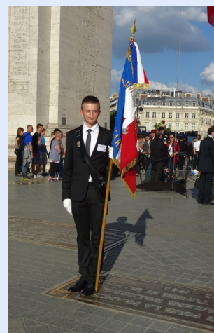
14 juillet 2014 à Paris

Pour terminer, les deux prochaines commissions nationales sont fixées au 18 mars et 14 octobre 2015.