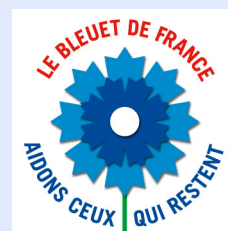
La Fleur du souvenir 2014

Rappelons que lors de la journée de championnat L1/L2 du 7 au 10 novembre, toutes les équipes arboraient le Bleuet sur le maillot, tout comme l'équipe de France de rugby pendant la tournée d'automne.