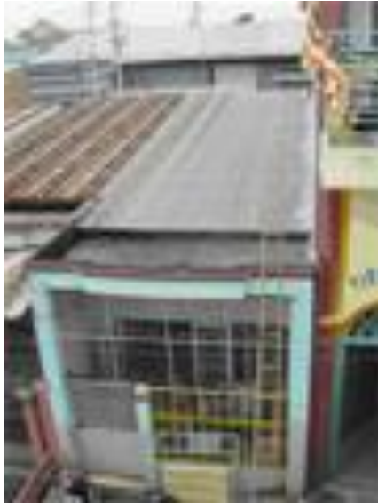
PHOTO BATIMENT ECOLE (Mitoyen)