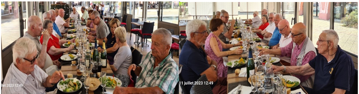
Repas CA de juillet