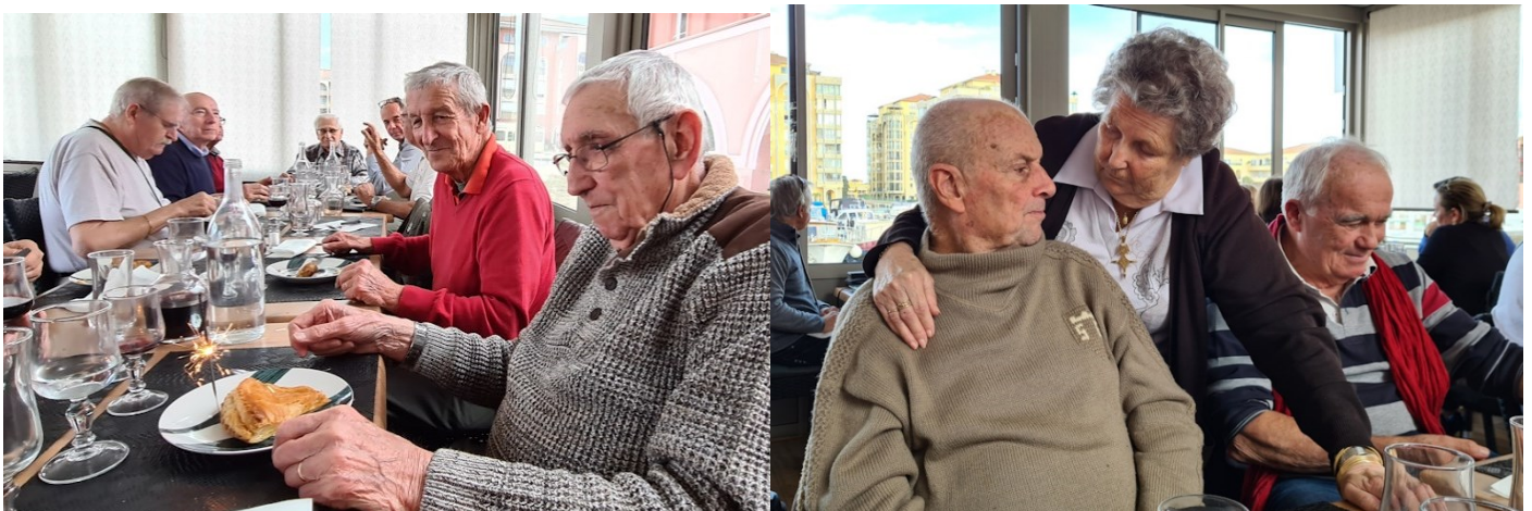
La galette du CA