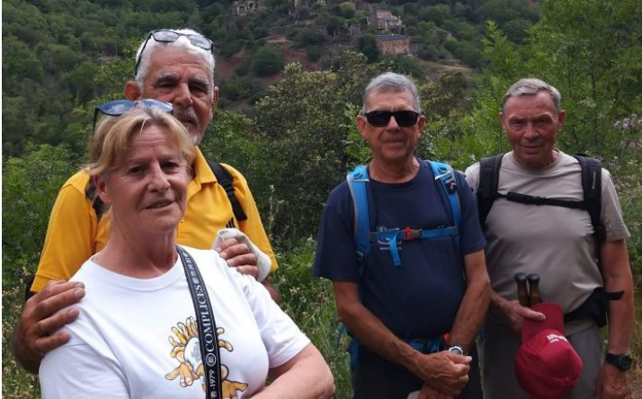
L'équipe d'organisation et de reconnaissance

Rendez-vous à l'Automne pour la prochaine escapade.