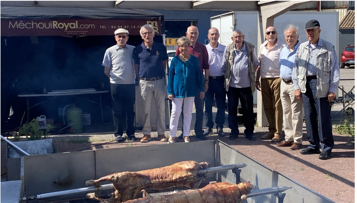
Méchoui MM à Lunel