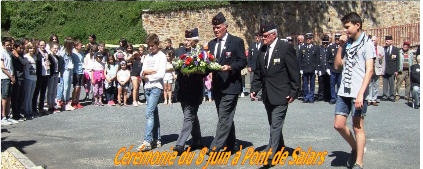
Cérémonie du 8 juin à Pont de Salars