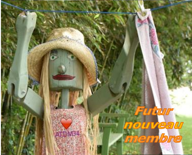
Futur nouveau membre