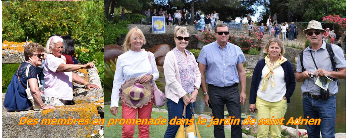
Des membres en promenade dans le jardin de saint Adrien