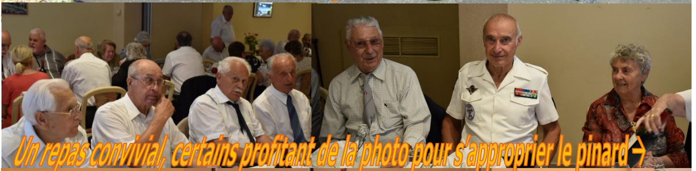
Un repas convivial, certains profitant de la photo pour s'approprier le pinard →