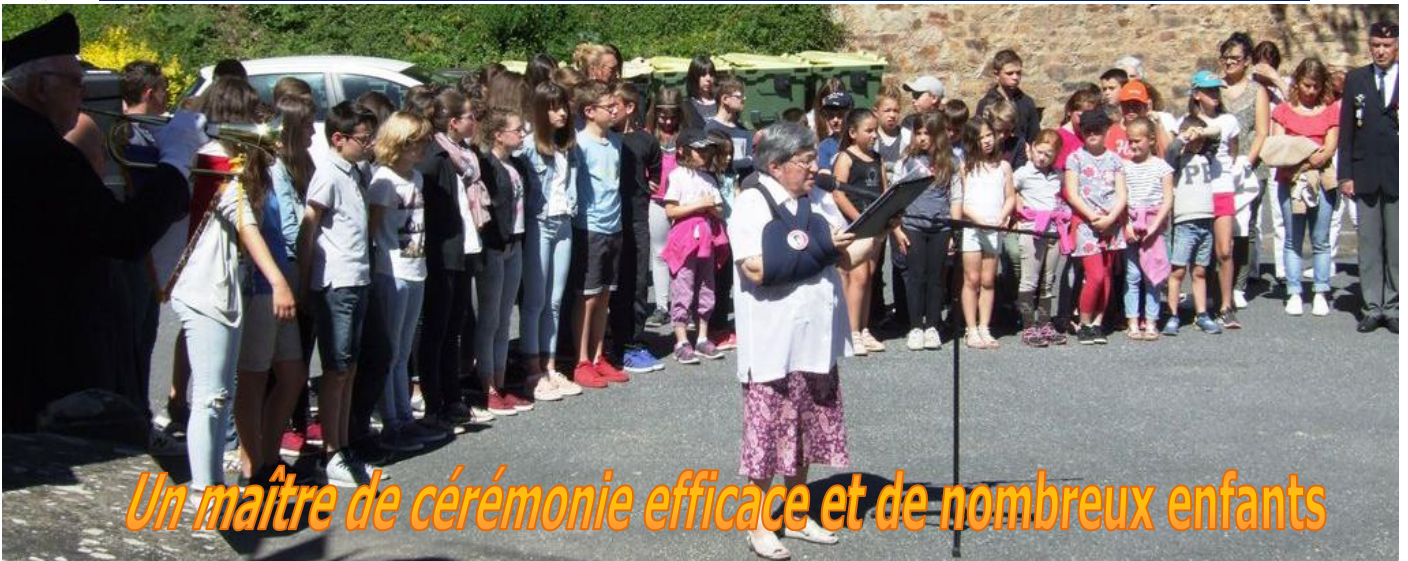
Un maître de cérémonie efficace et de nombreux enfants