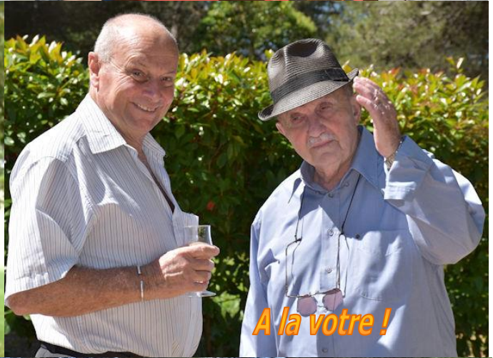
A la votre !