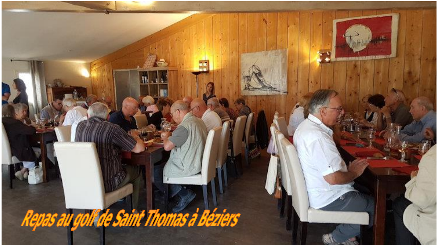
Repas au golf de Saint Thomas à Béziers