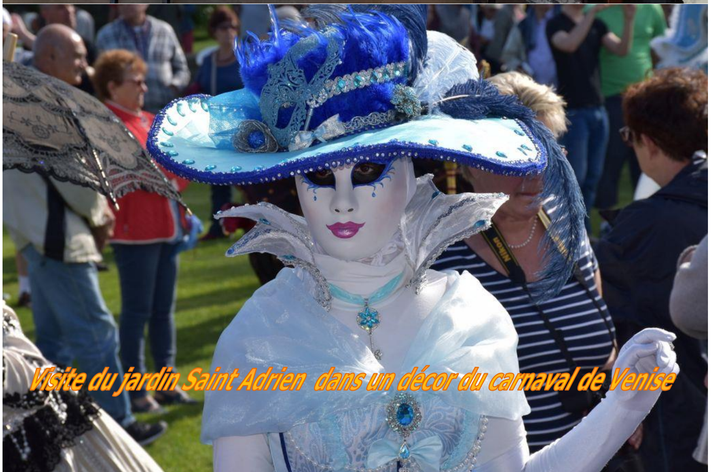
Visite du jardin Saint Adrien dans un décor du carnaval de Venise