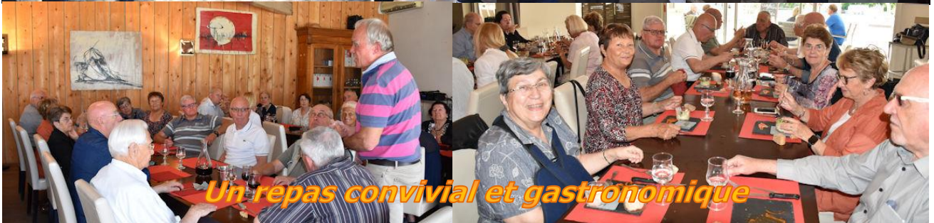
Un repas convivial et gastronomique