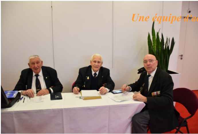
Une équipe d'accueil souriante