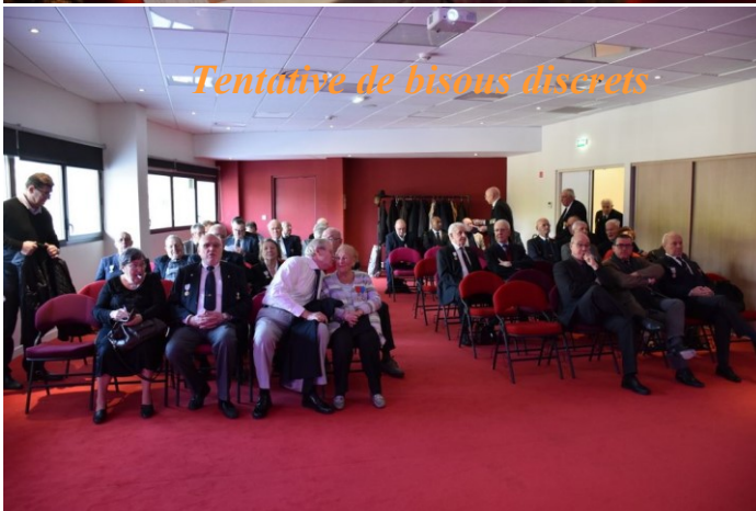
Tentative de bisous discrets