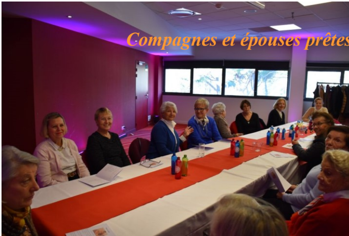
Compagnes et épouses prêtes pour la réalisation d'un parfum