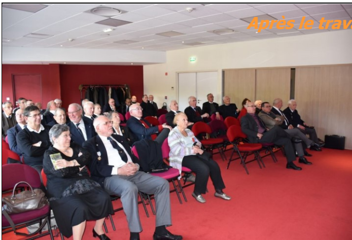
Après le travail le réconfort