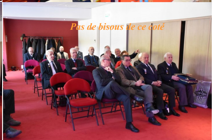
Pas de bisous de ce côté