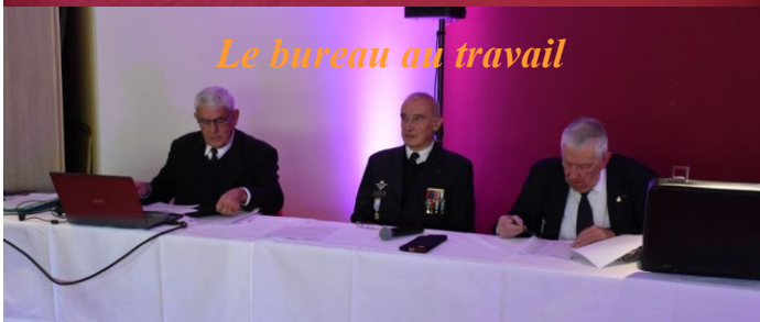
Le bureau au travail