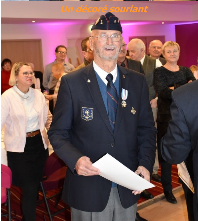
Un décoré souriant