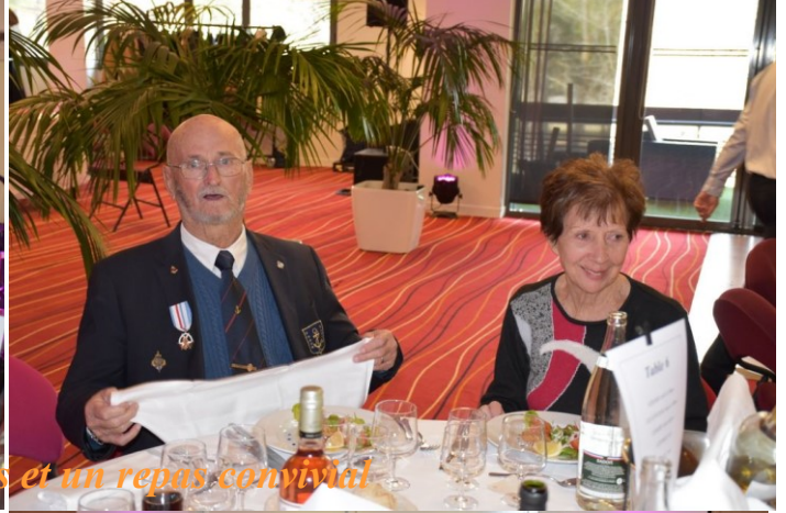
Des convives souriants et un repas convivial