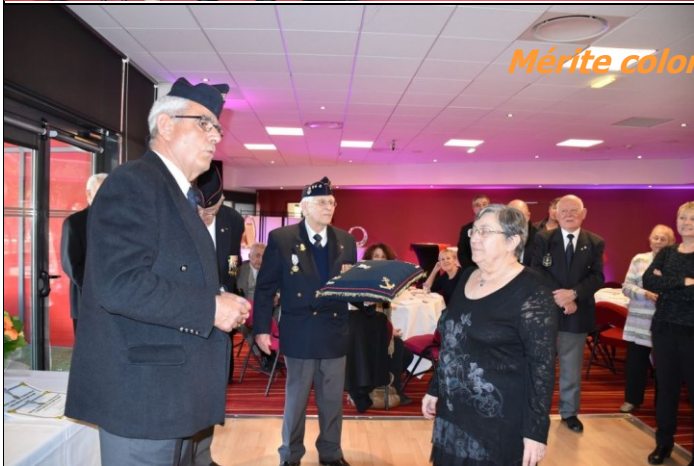
Mérite colonial et fleurs