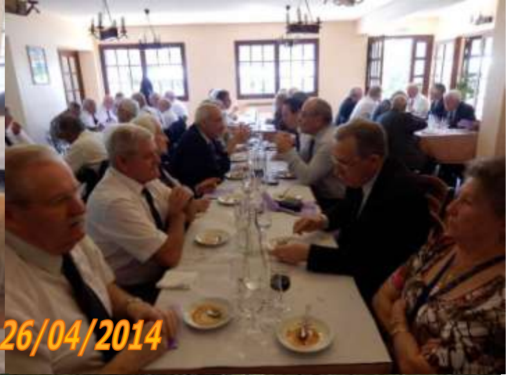
Fréjus le 26/04/2014