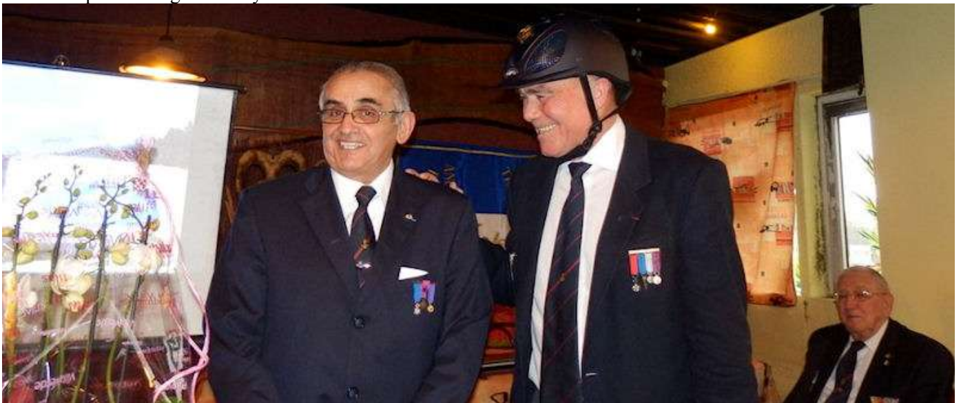
Photographe enquêteur piégé par le choix de la photo du rédacteur