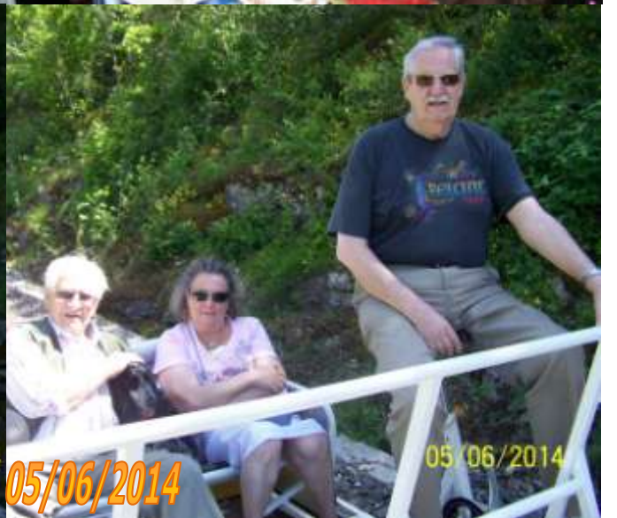
Sortie Larzac le 05/06/2014

Bulletin d'inscription Bazeilles 2014 inclu dans ce numéro