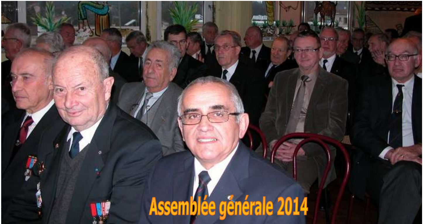
Assemblée générale 2014