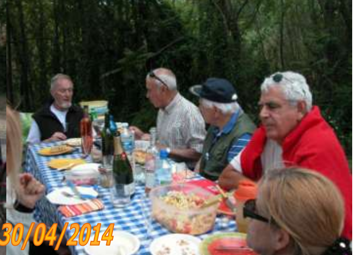
Mouréze le 30/04/2014