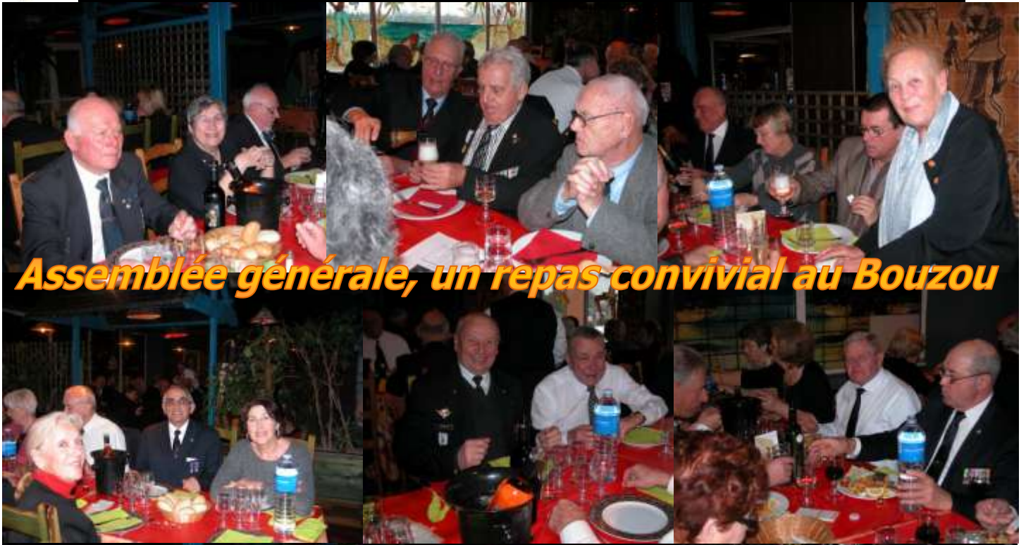
Assemblée générale, un repas convivial au Bouzou