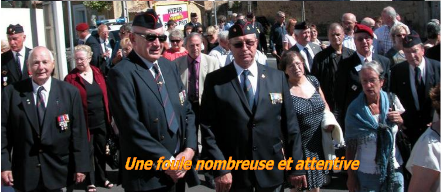
Une foule nombreuse et attentive