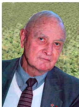
Général Pierre Grasser