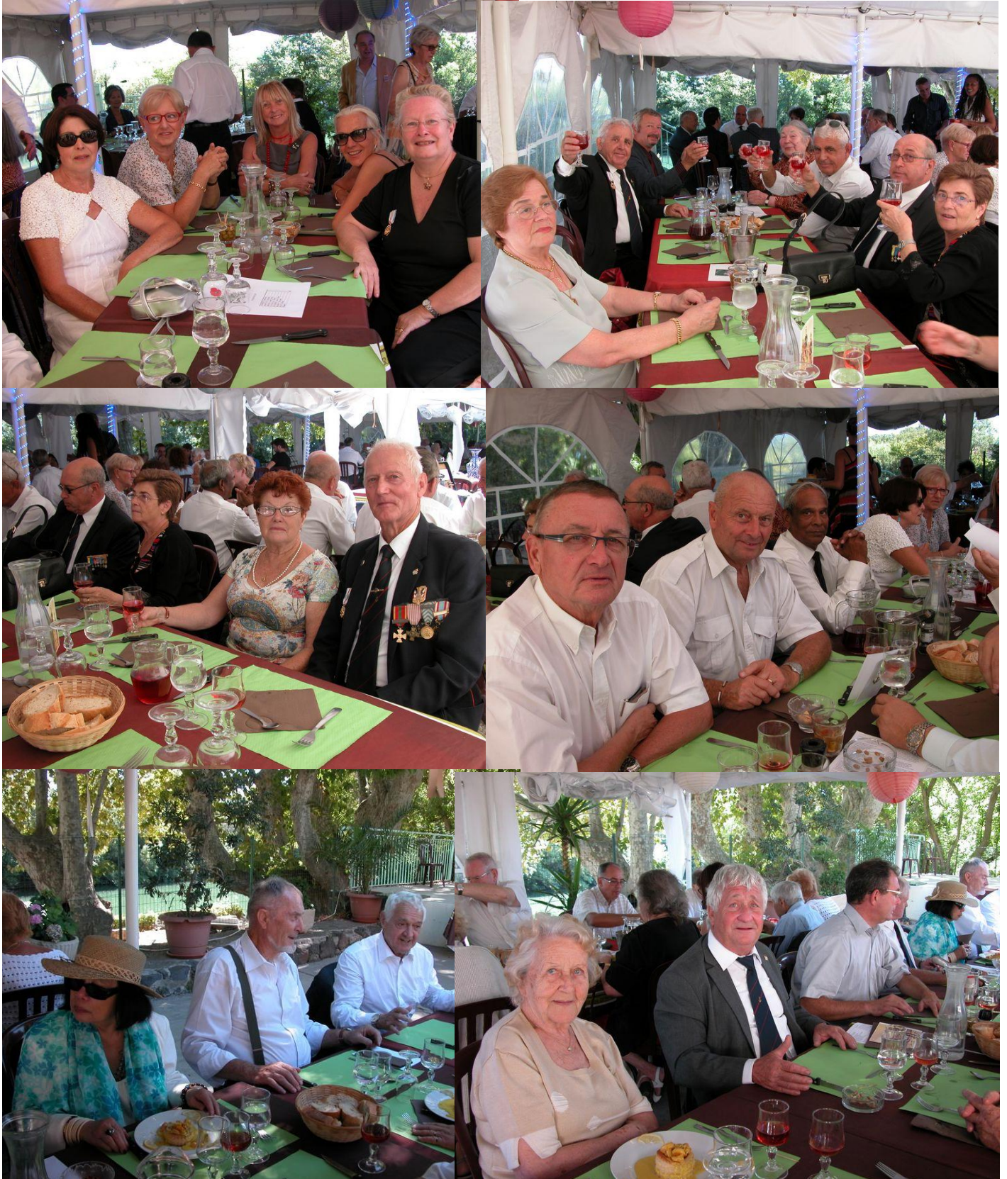
Bazeilles 2013, un repas convivial à la guinguette de Bessan