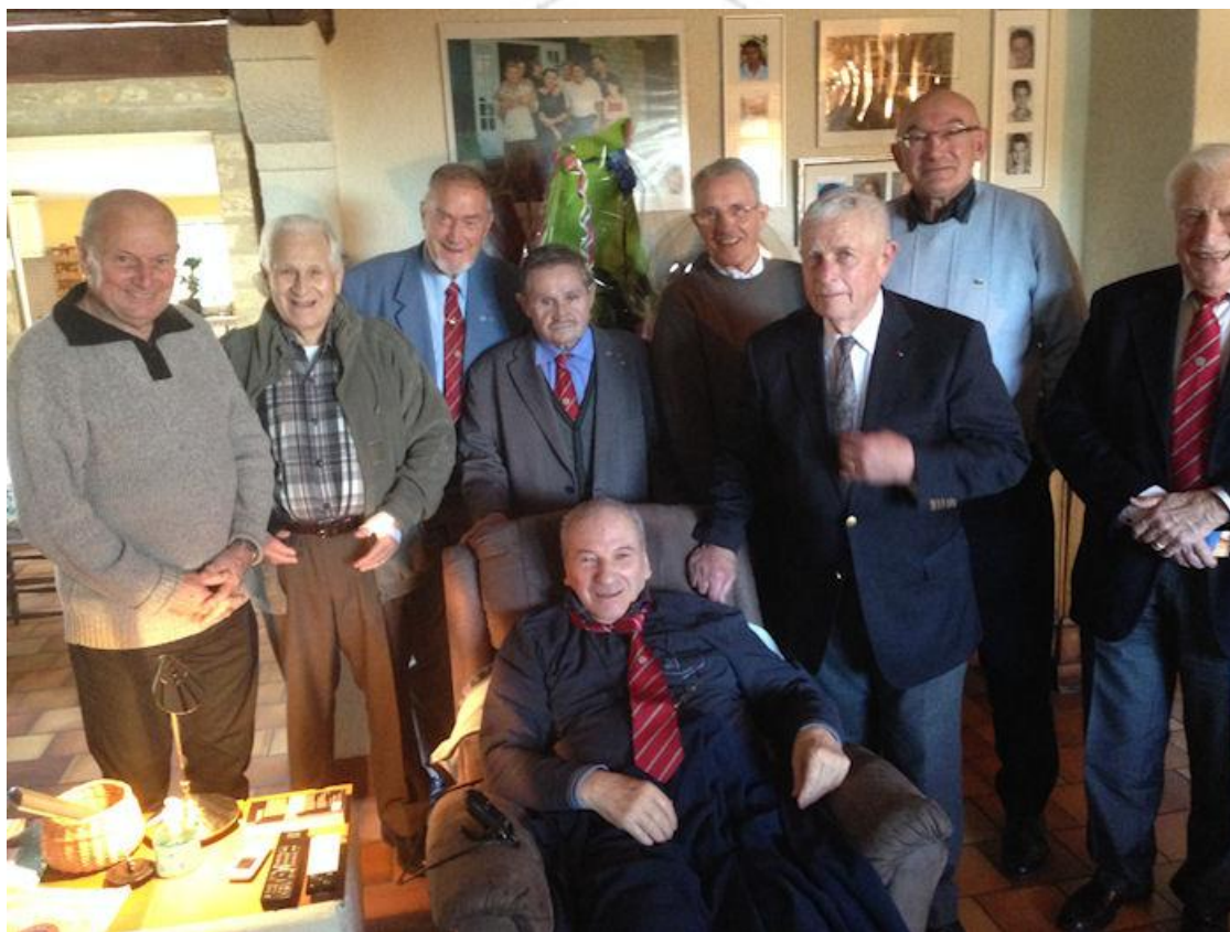
Une délégation de l'ATDM34 et des DPLV-LS a rendu visite à notre camarade TRUC le 26 novembre 2013