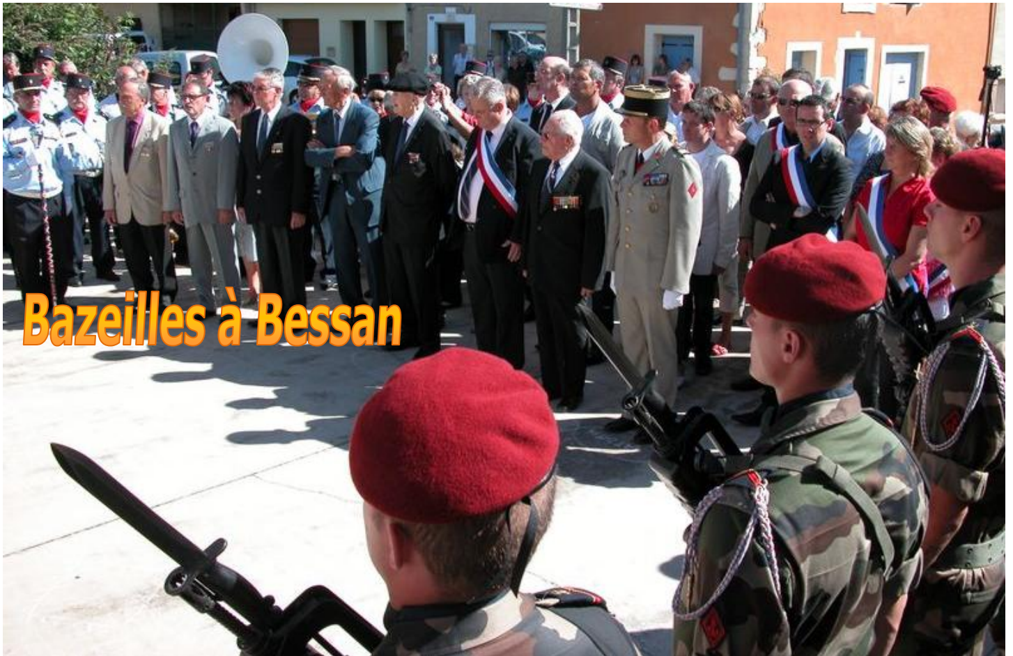
Bazeilles à Bessan