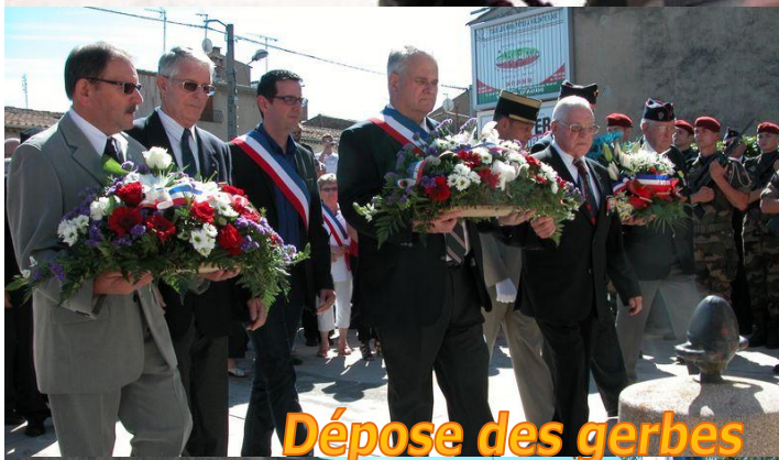
Dépose des gerbes