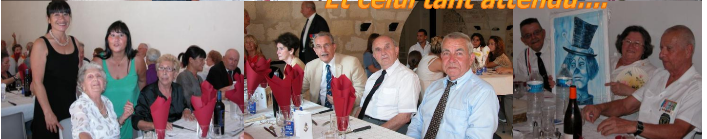
Et celui tant attendu....