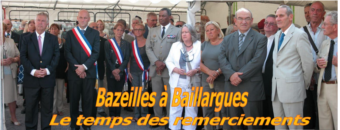
Bazeilles à Baillargues Le temps des remerciements