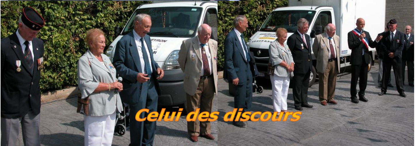
Celui des discours