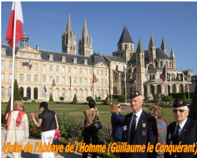
Visite de l'Abbaye de l'Homme (Guillaume le Conquérant)