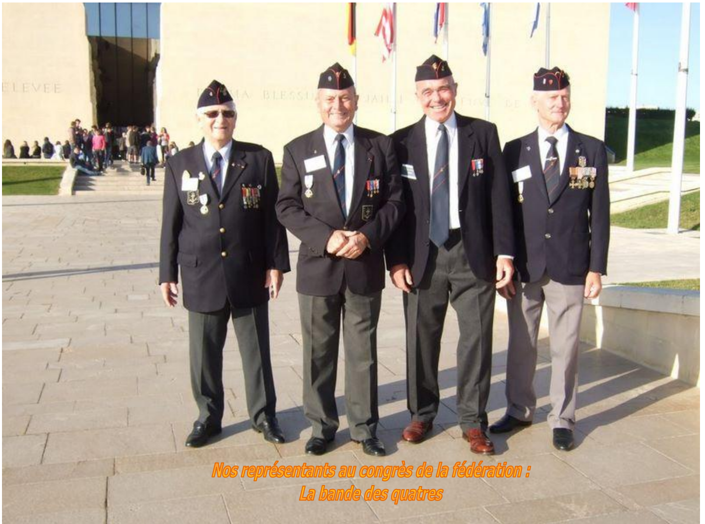
Nos représentants au congrès de la fédération : La bande des quatre