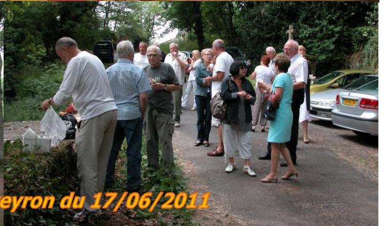
Sortie en aveyron du 17/06/2011