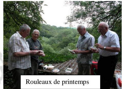
Rouleaux de printemps

Dès que le gros de la troupe fût arrivé, thermos et ravitaillement surgirent pour nous remettre de la route, ces agapes comprenaient des rouleaux de printemps