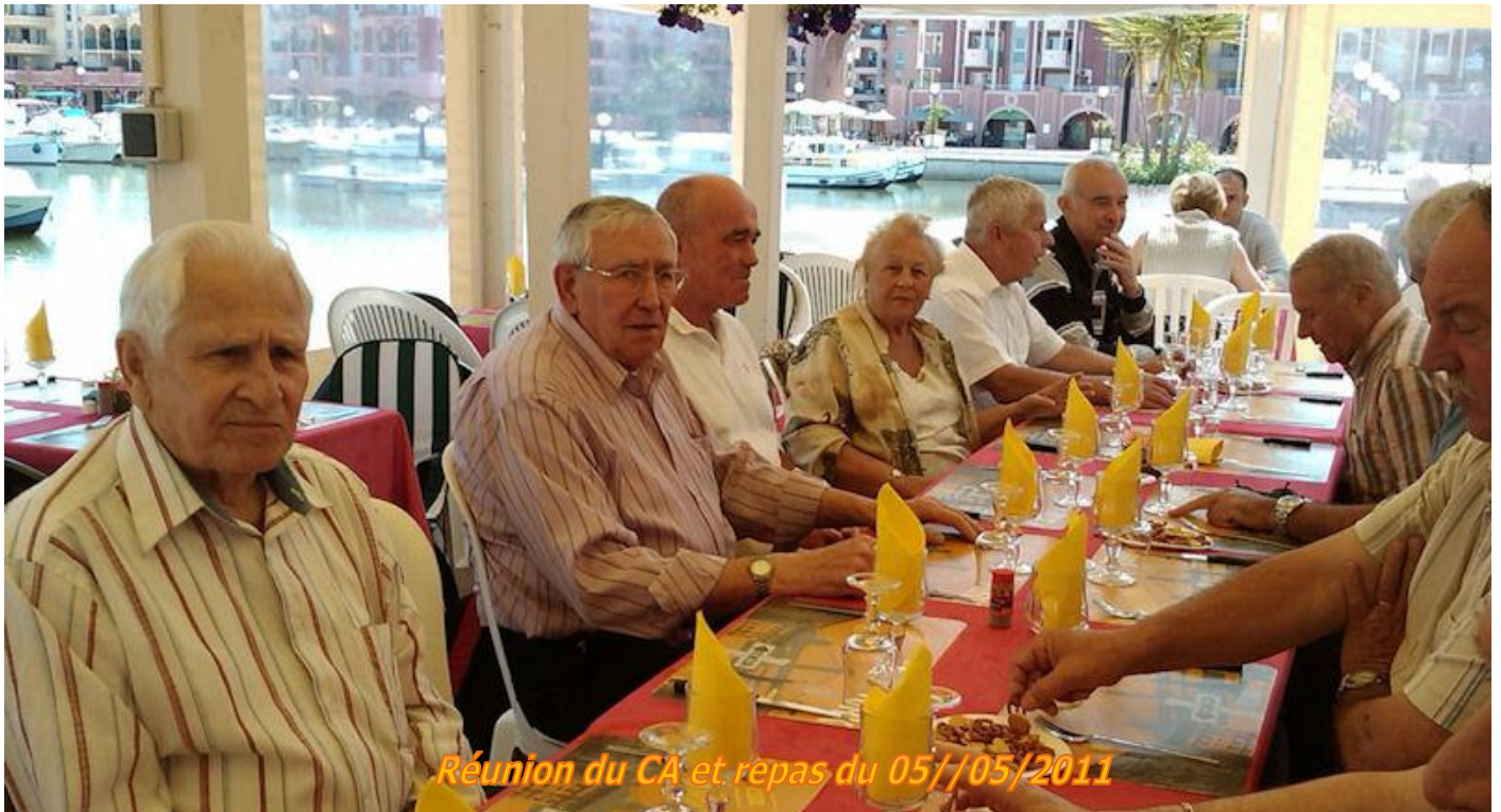
Réunion du CA et repas du 05/05/2011