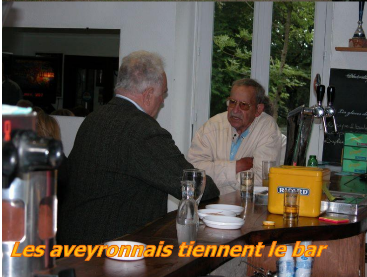
Les aveyronnais tiennent le bar