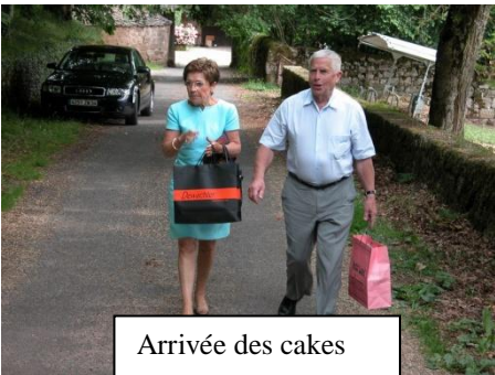
Arrivée des cakes

Nous partîmes de bon matin pour l'Aveyron, après une route sans histoire, un passage du pont de Millau à la vue magnifique, nous arrivâmes au prieuré de Comberoumal. Historique de cette propriété privée : En 1193, Alphonse II, roi d'Aragon donna aux religieux, le ruisseau de Vézoubies, depuis sa source jusqu'à son embouchure sur le Tarn, avec les moulins qui y sont bâtis . Ce don fut confirmé par son successeur, Pierre d'Aragon, qui plaça Comberoumal sous sa sauvegarde en 1206. En 1285, 4 religieux y résident, et en 1317, Comberoumal fut unie à Saint-Michel-de-Lodève. En 1668, lors de la visite pastorale de G. Voyer de Paulmy, Comberoumal est à l'abandon. En 1737, le prieur se réserve le droit : "de faire abattre si bon lui semble les greniers et cave qui sont dans l'église, pour la bienséance d'icelle" . En 1768 elle n'hébergeait plus que deux religieux, et l'église était dans un état : "d'indécence à ne pouvoir y faire aucun service " . Vendue comme bien national à la Révolution, elle fut achetée le 8 avril 1791 par Henri-Julien de Pegayrolles pour le prix de 39.000 livres, qui la conserva jusqu'en 1820, date à laquelle elle fut rachetée par la famille qui la possède actuellement. Comberoumal est inscrit à l'Inventaire supplémentaire depuis le 25 juin 1929.