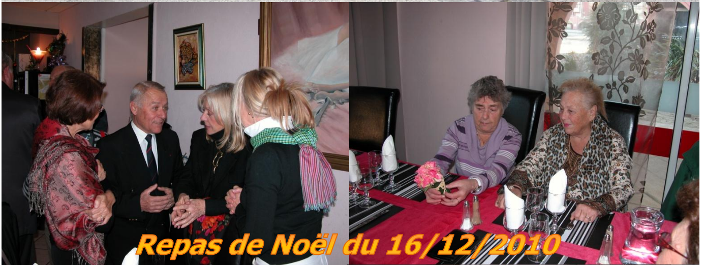
Repas de Noël du 16/12/2010