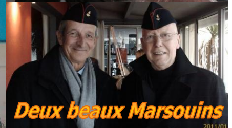
Deux beaux Marsouins