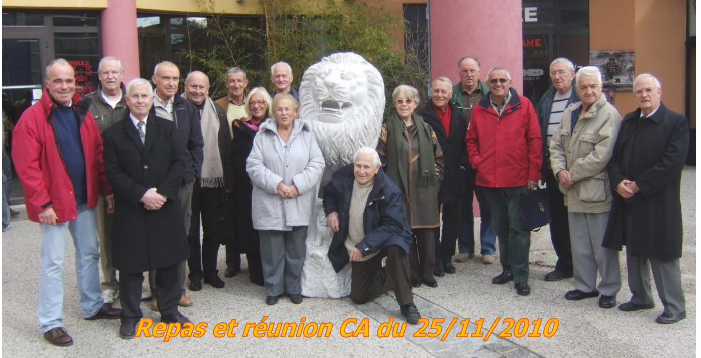
Repas et réunion CA du 25/11/2010