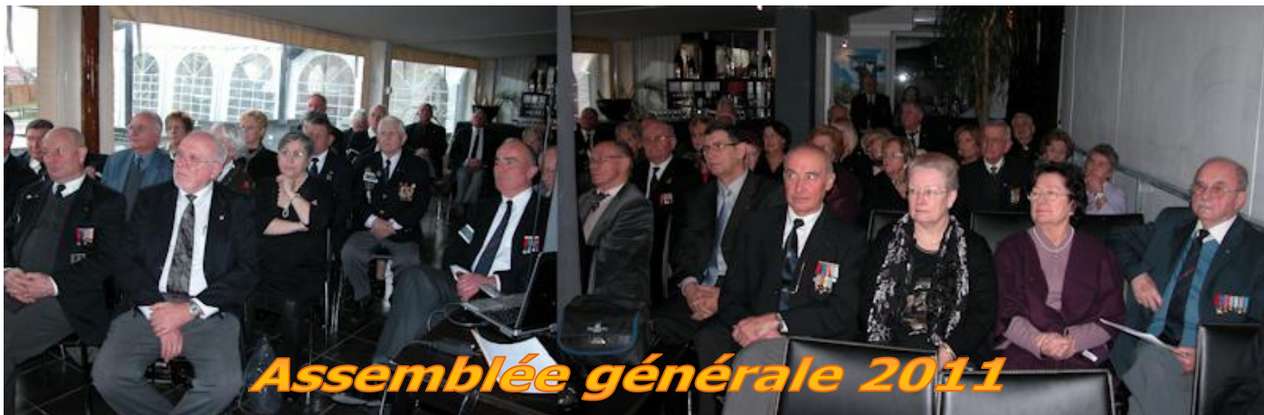
Assemblée générale 2011