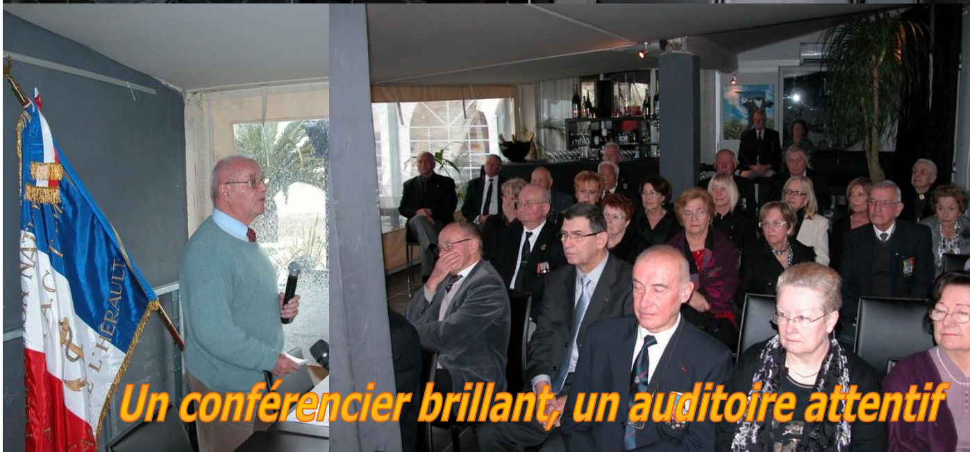
Un conférencier brillant, un auditoire attentif