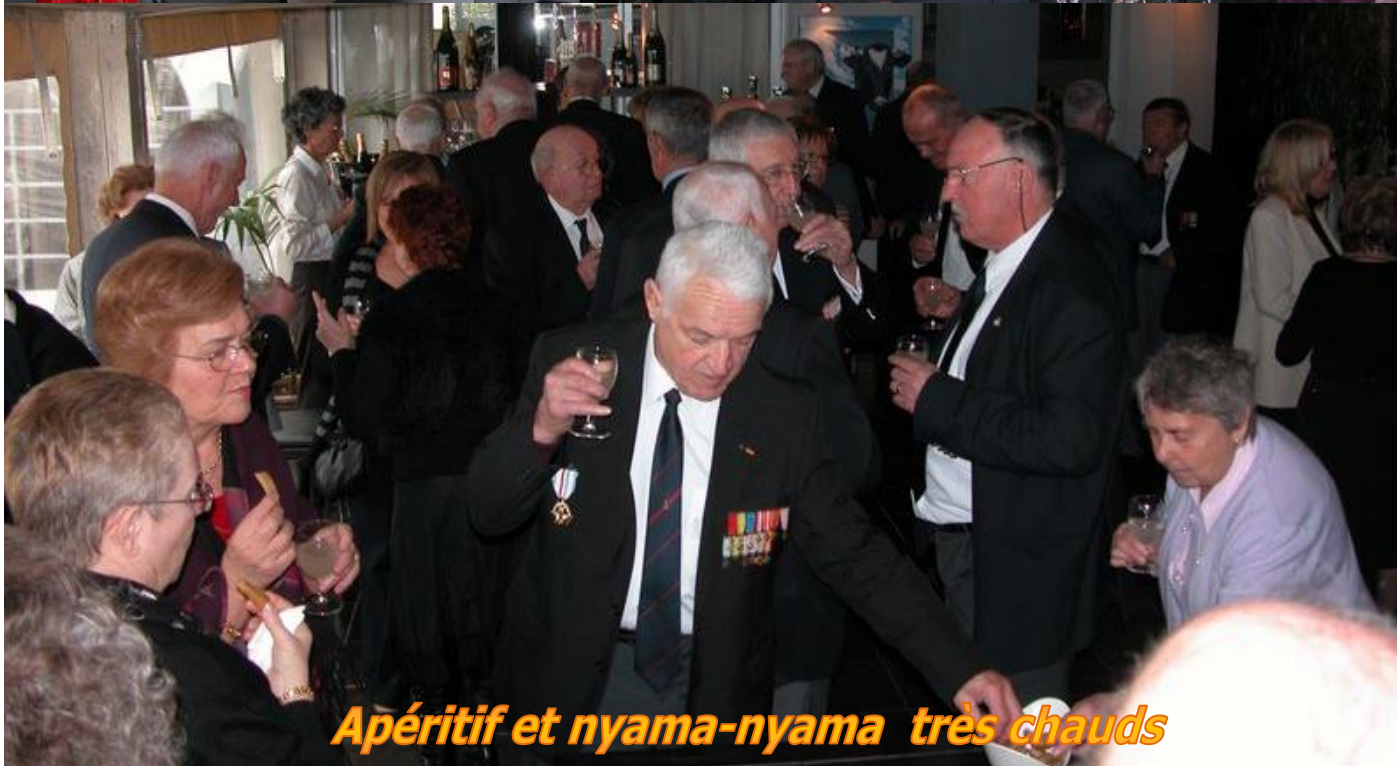
Apéritif et nyama-nyama très chauds