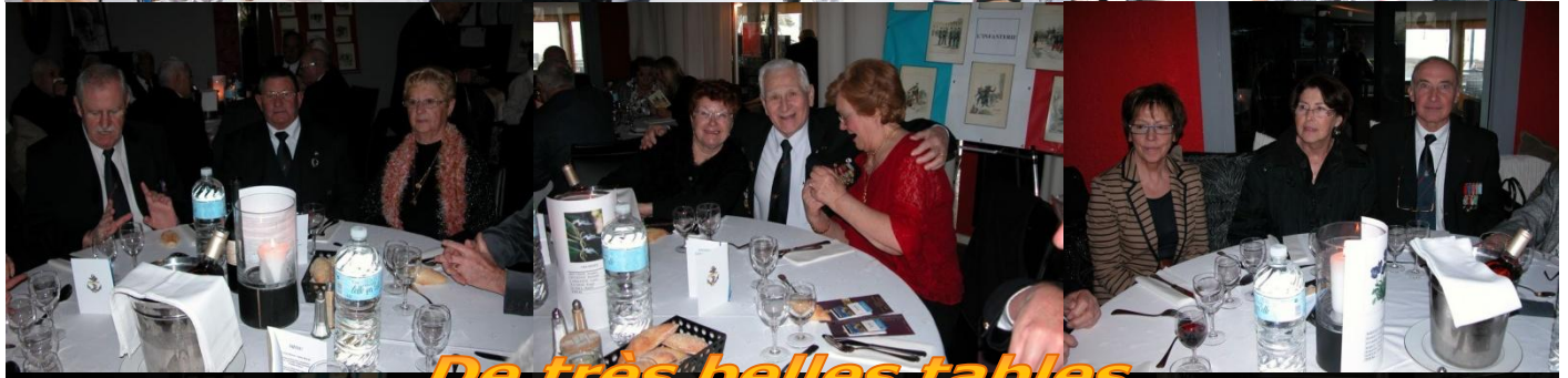
De très belles tables