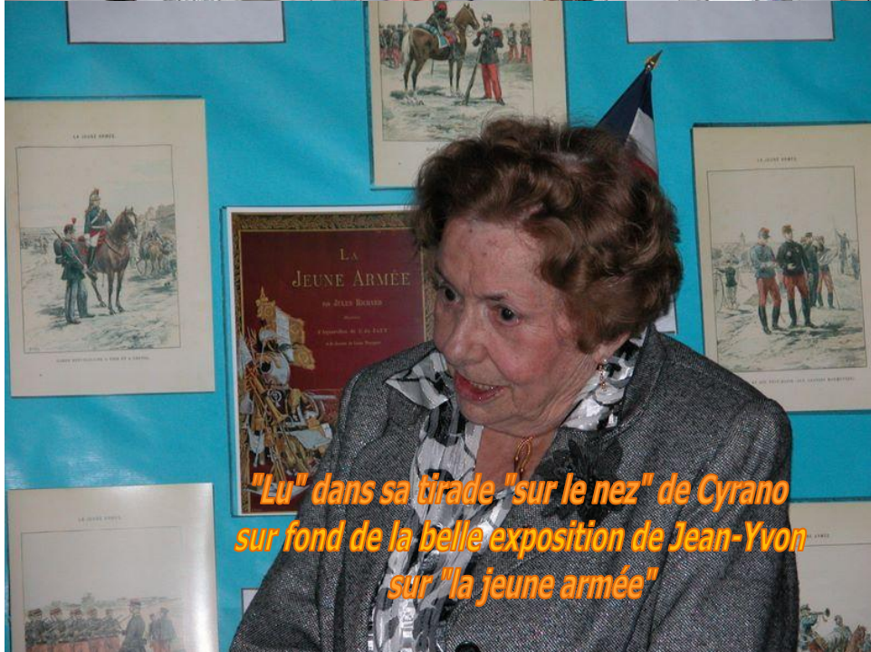
"Lu" dans sa tirade "sur le nez" de Cyrano sur fond de la belle exposition de Jean-Yvon sur "la jeune armée"