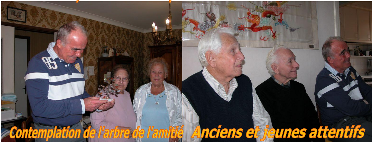
Contemplation de l'arbre de l'amitié Anciens et jeunes attentifs