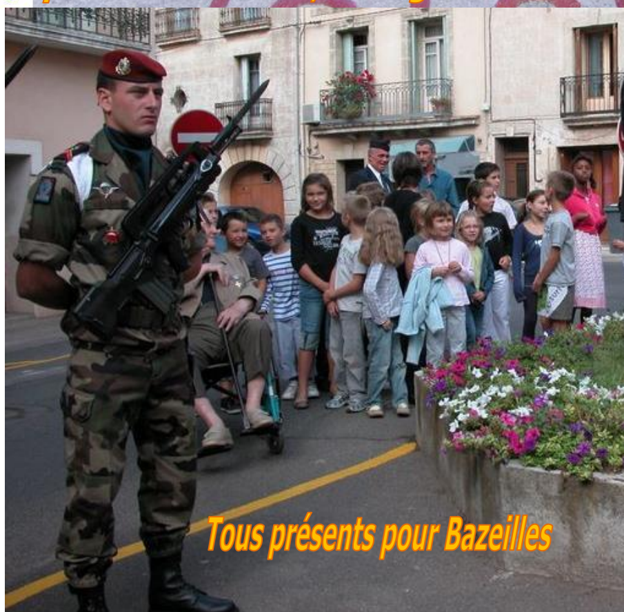
Tous présents pour Bazeilles