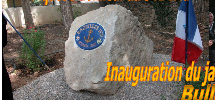
Inauguration du jardin Bazeilles 1870