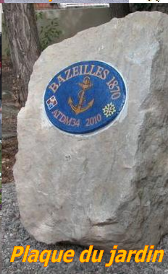
Plaque du jardin