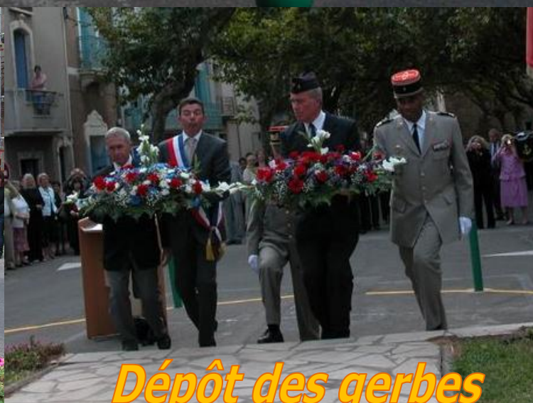
Dépôt des gerbes