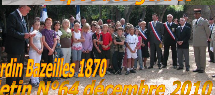
Bulletin N°64 décembre 2010