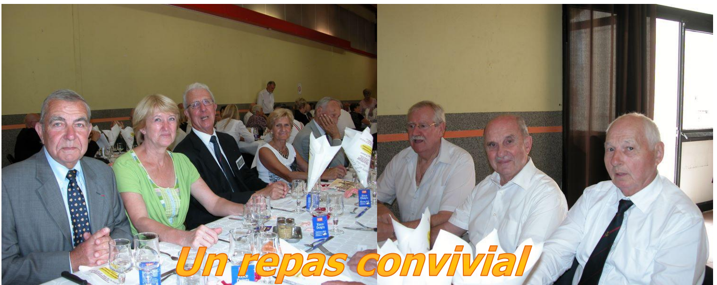
Un repas convivial