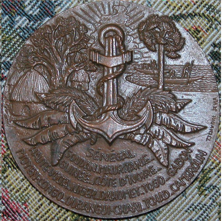
Médaille du cinquantenaire des troupes africaines de notre camarade Pibouleau