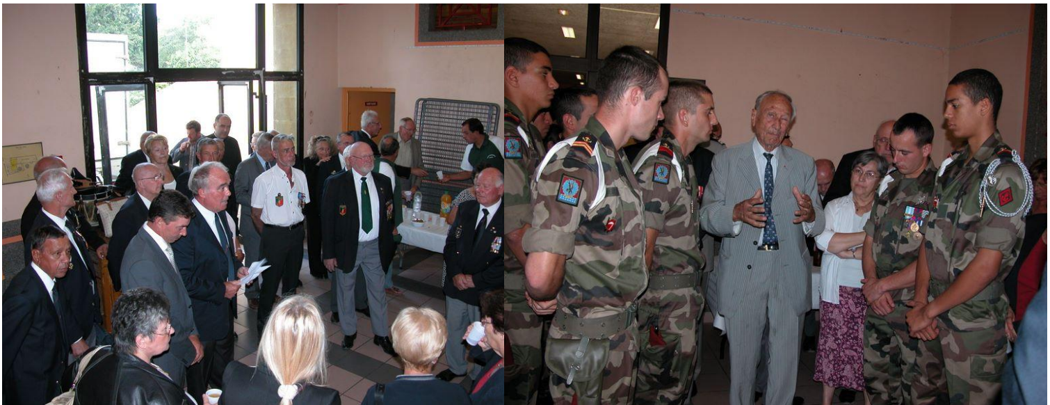
Remerciements et remise de cadeaux Notre ambassadeur conteur