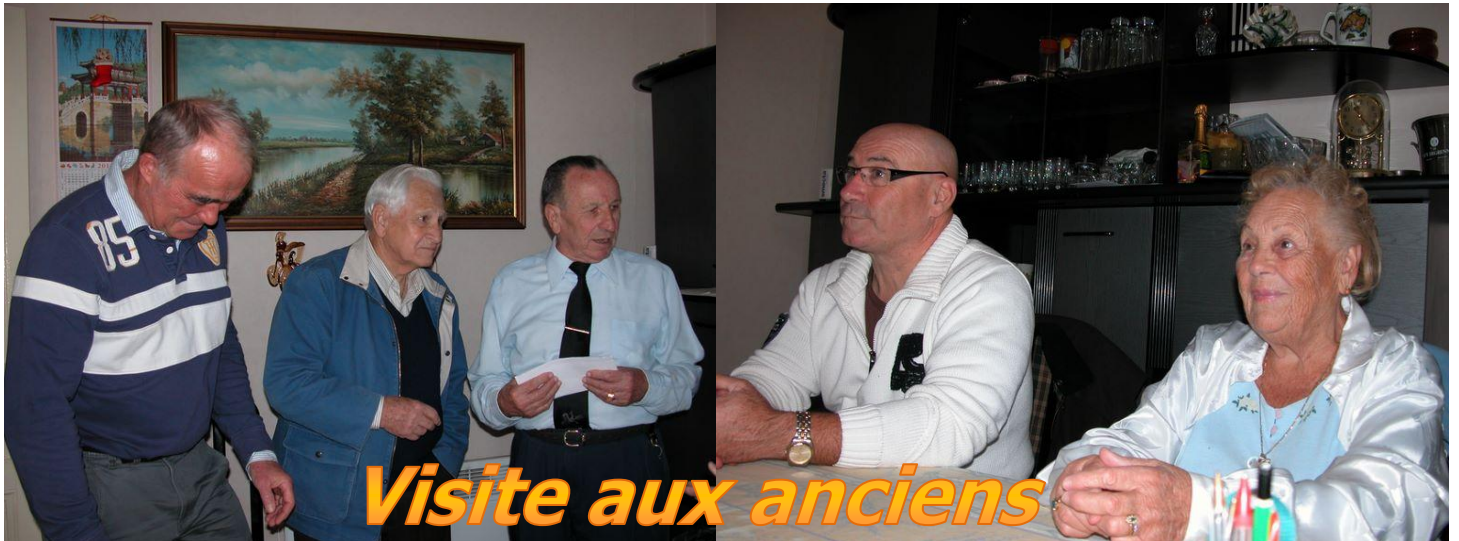
Visite aux anciens