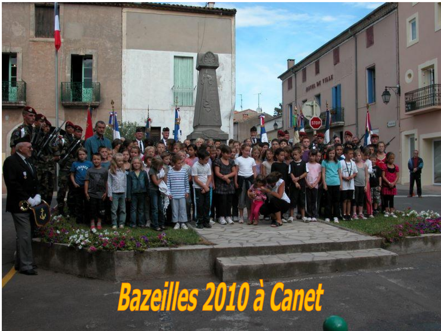
Bazeilles 2010 à Canet