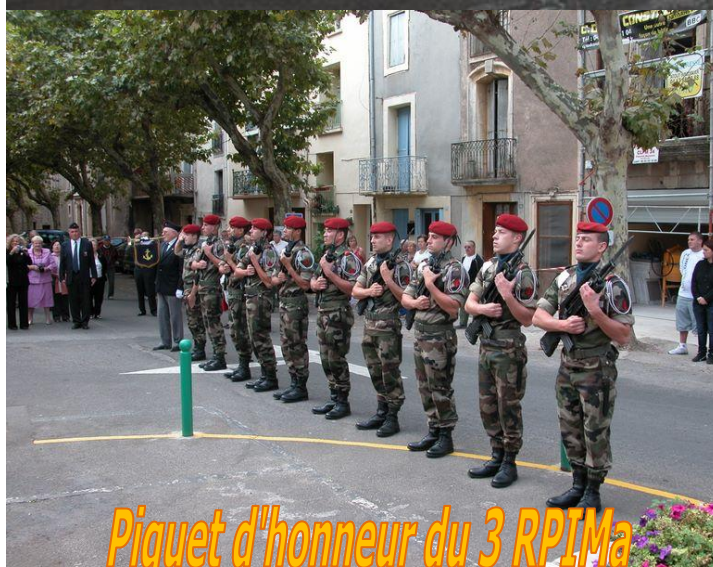
Piquet d'honneur du 3 RPIMa