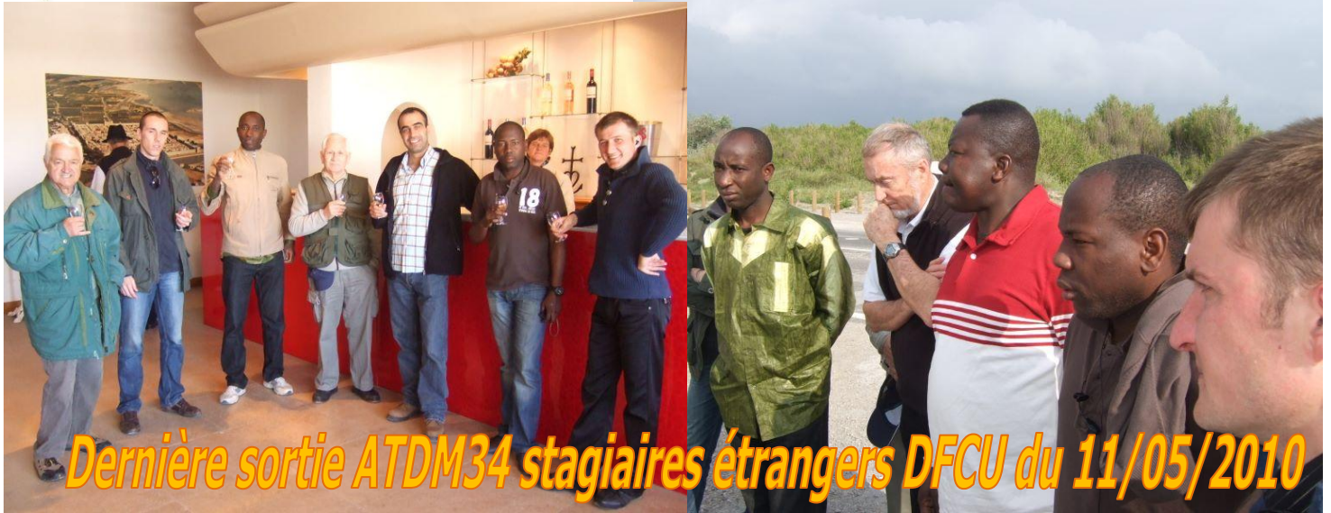
Dernière sortie ATDM34 stagiaires étrangers DFCU du 11/05/2010