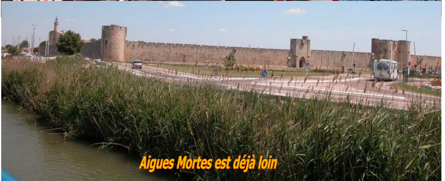
Aigues Mortes est déjà loin