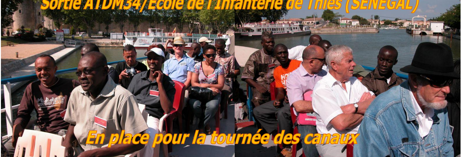
En place pour la tournée des canaux