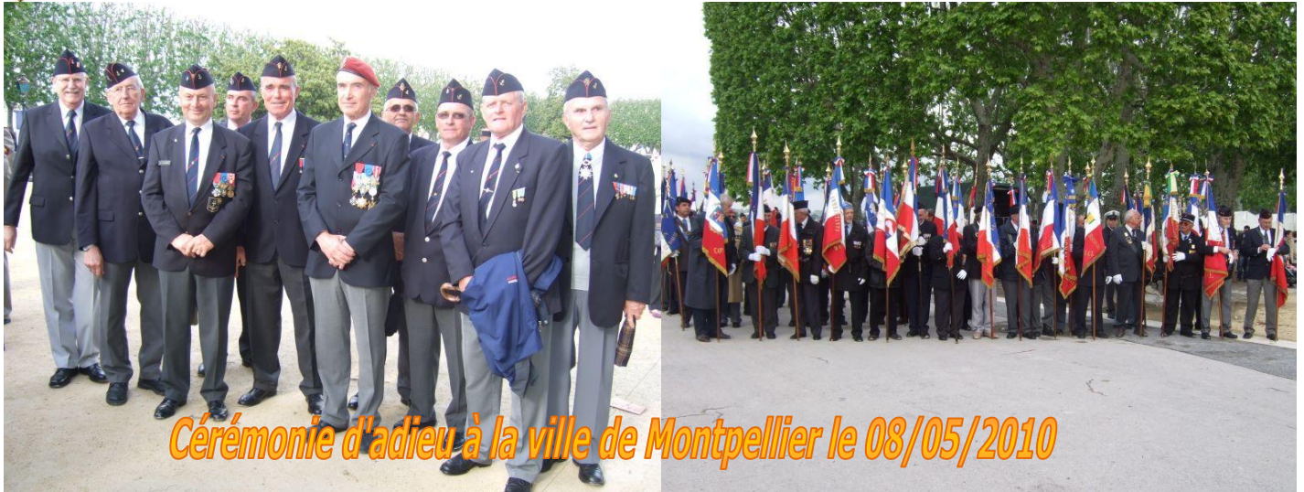
Cérémonie d'adieu à la ville de Montpellier le 08/05/2010