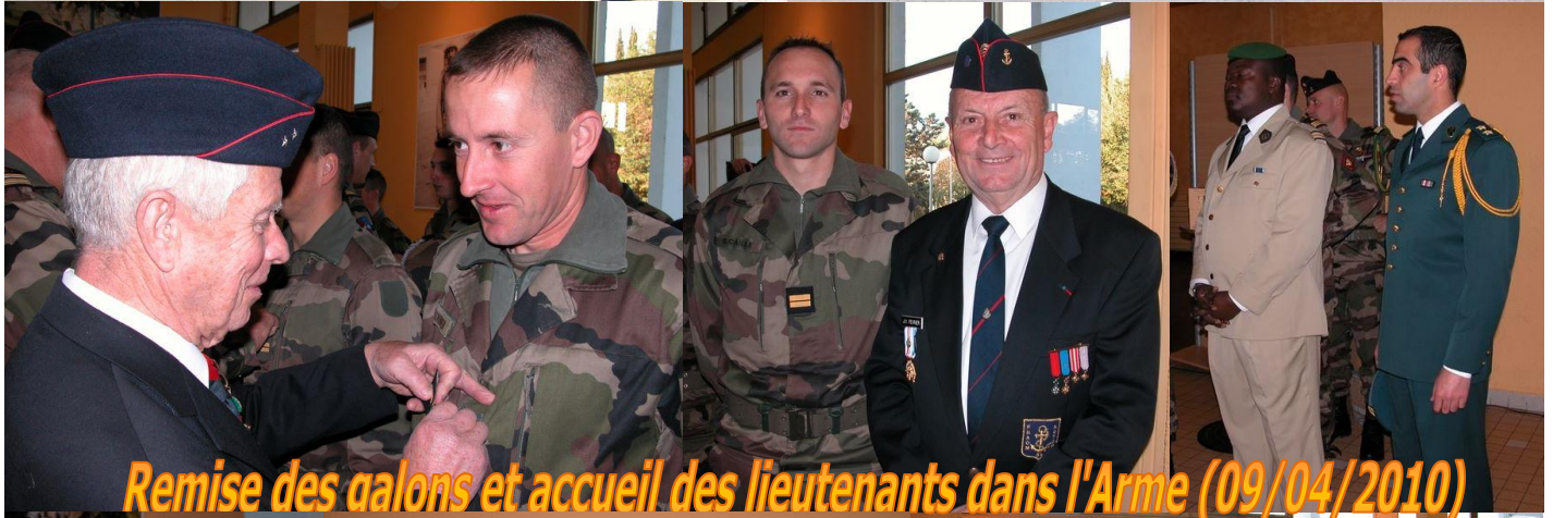
Remise des galons et accueil des lieutenants dans l'Arme (09/04/2010)