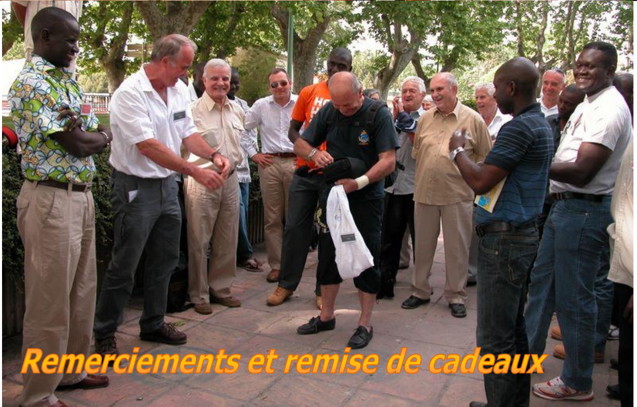
Remerciements et remise de cadeaux