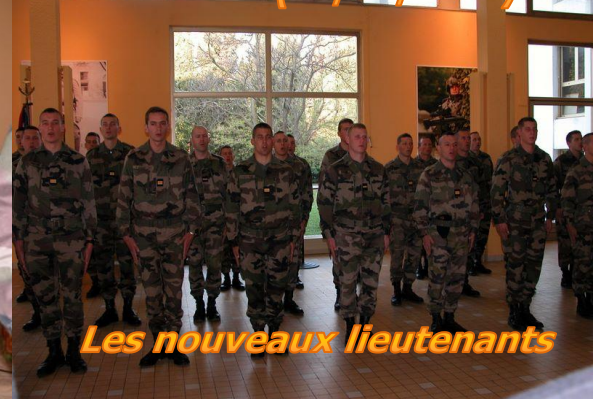
Les nouveaux lieutenants