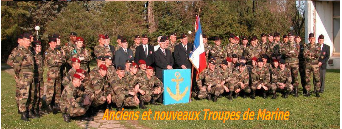
Anciens et nouveaux Troupes de Marine