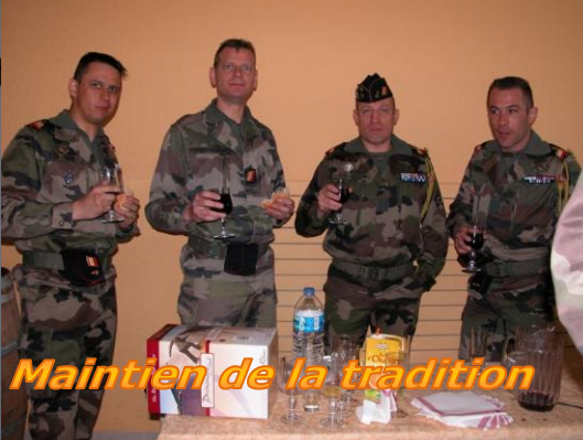
Maintien de la tradition