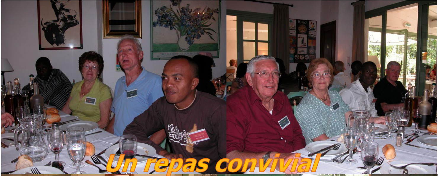
Un repas convivial