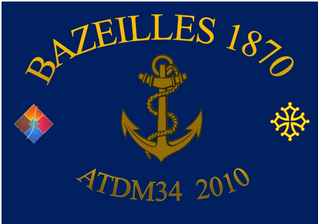
La plaque destinée au jardin qui sera inauguré à l'occasion des cérémonies de Bazeilles 2010