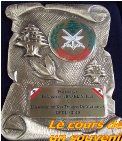
Le cours des Capitaine a remis un souvenir au Colonel Fevrier