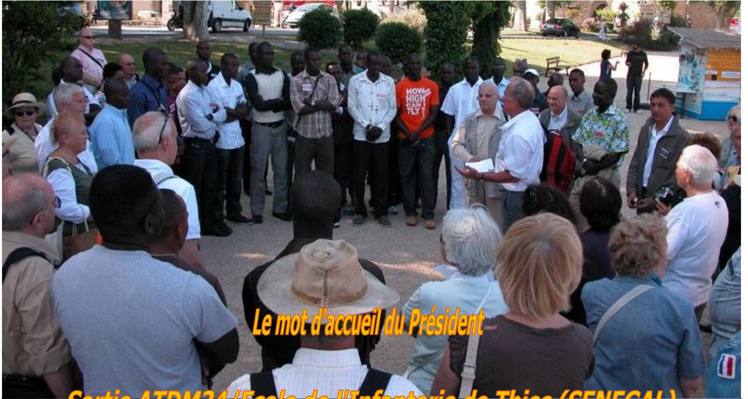
Le mot d'accueil du Président