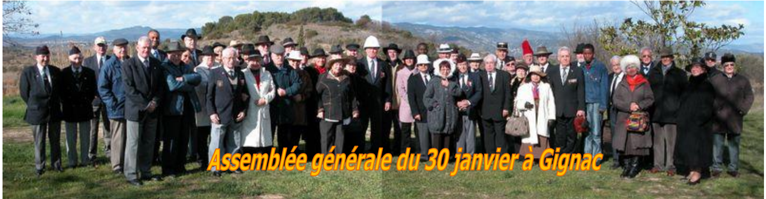
Assemblée générale du 30 janvier à Gignac