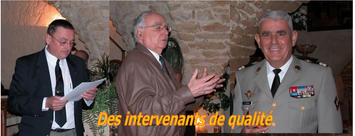
Des intervenants de qualité