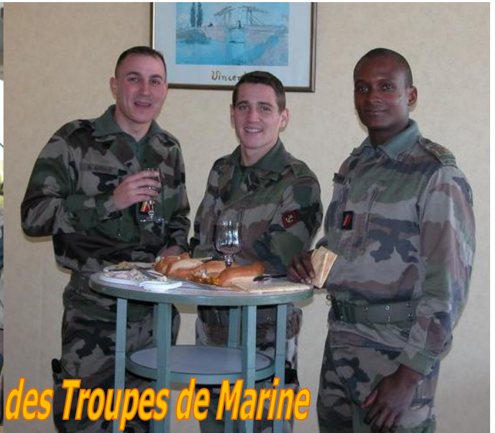
La galette de l'amicale des Troupes de Marine de l'Ecole de l'Infanterie