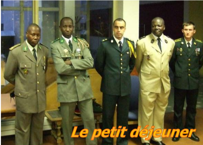
Le petit déjeuner