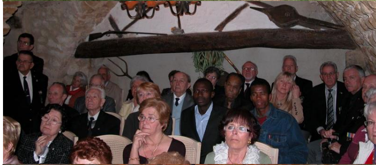
Une assemblée attentive