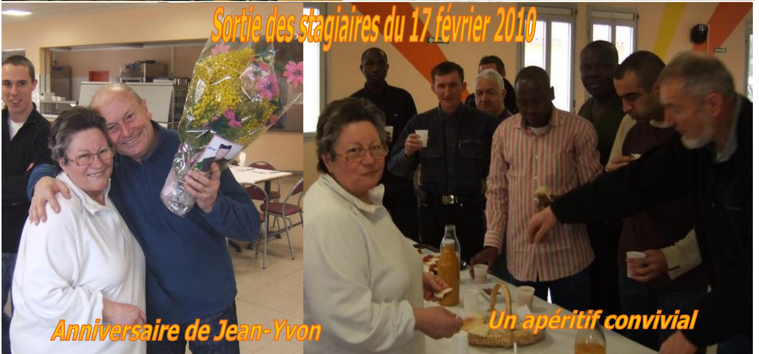
Sortie des stagiaires du 17 février 2010