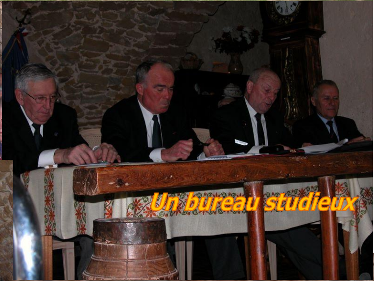
Un bureau studieux