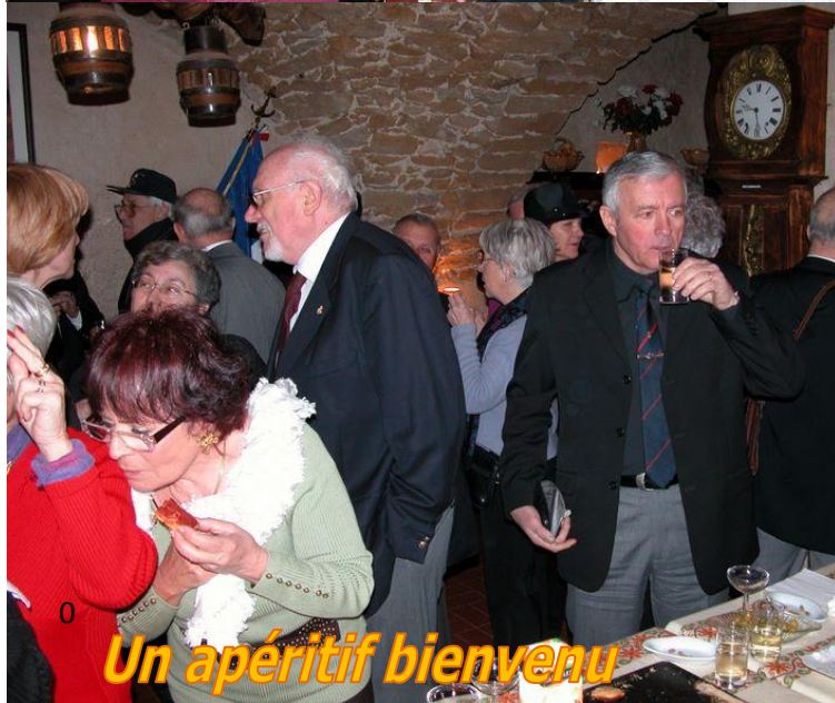
Un apéritif bienvenu