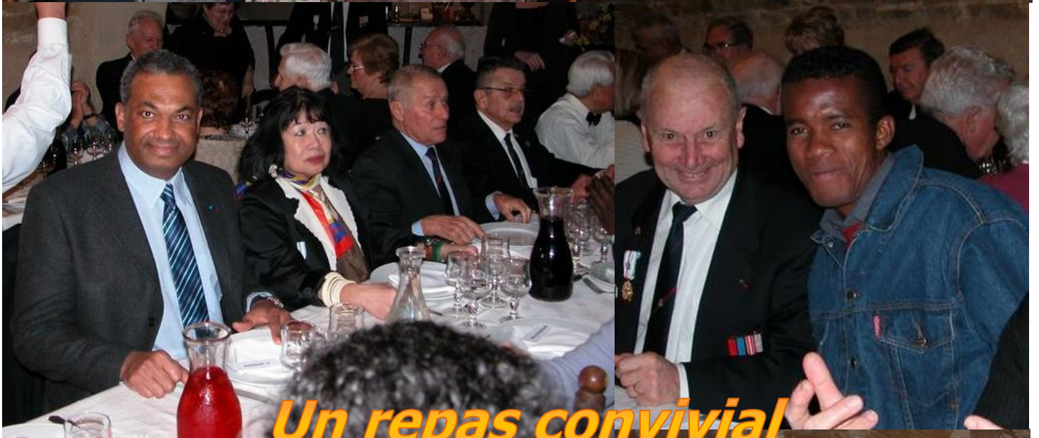
Un repas convivial