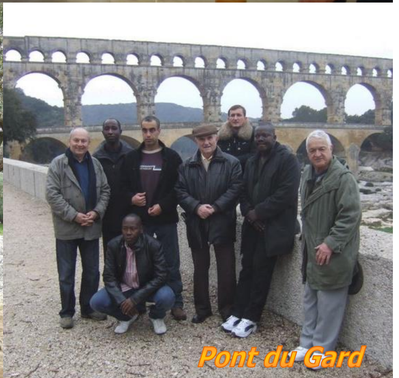
Pont du Gard