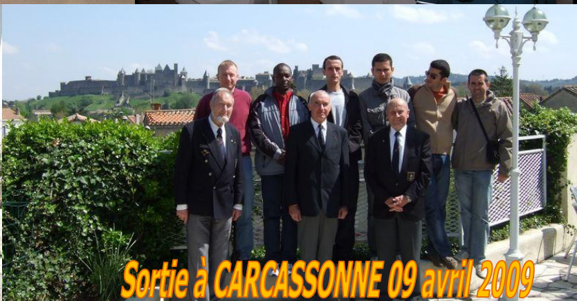
Sortie à CARCASSONNE 09 avril 2009