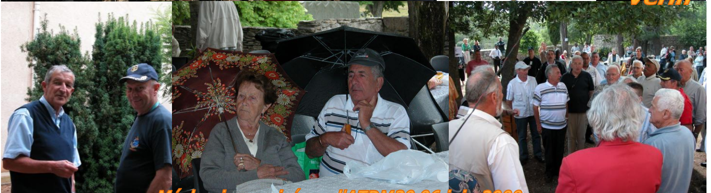
Méchoui organisé par l'ATDM30 06 juin 2009