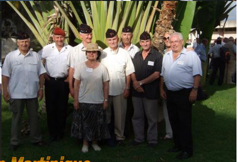
L'ATDM34 en Martinique