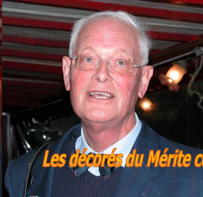
Les décorés du Mérite colonial