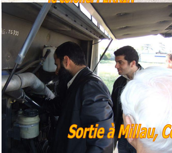
Sortie à Millau, Couvertoirade du 01 mai 2009