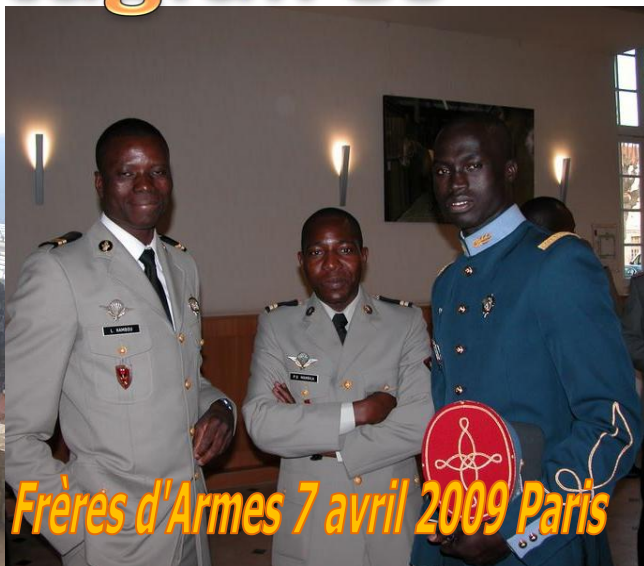
Frères d'Armes 7 avril 2009 Paris