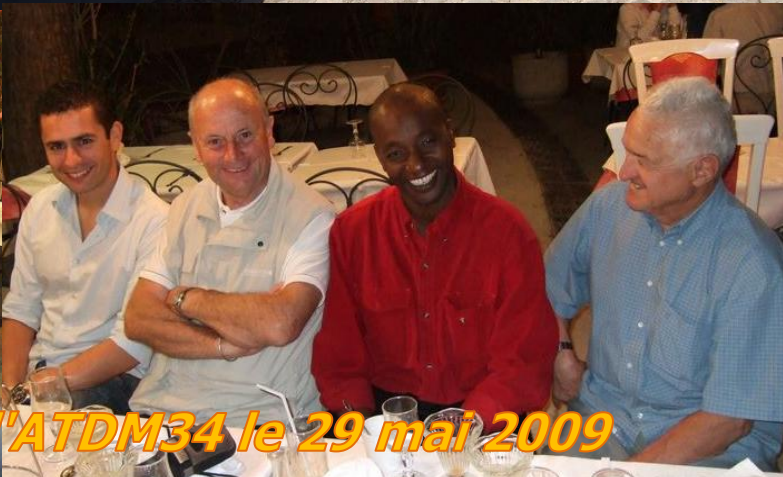
Les stagiaires invitent l'ATDM34 le 29 mai 2009