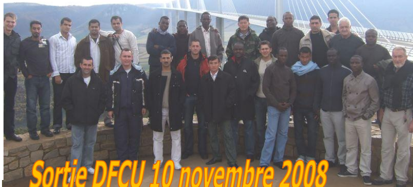
Sortie DFCU 10 novembre 2008