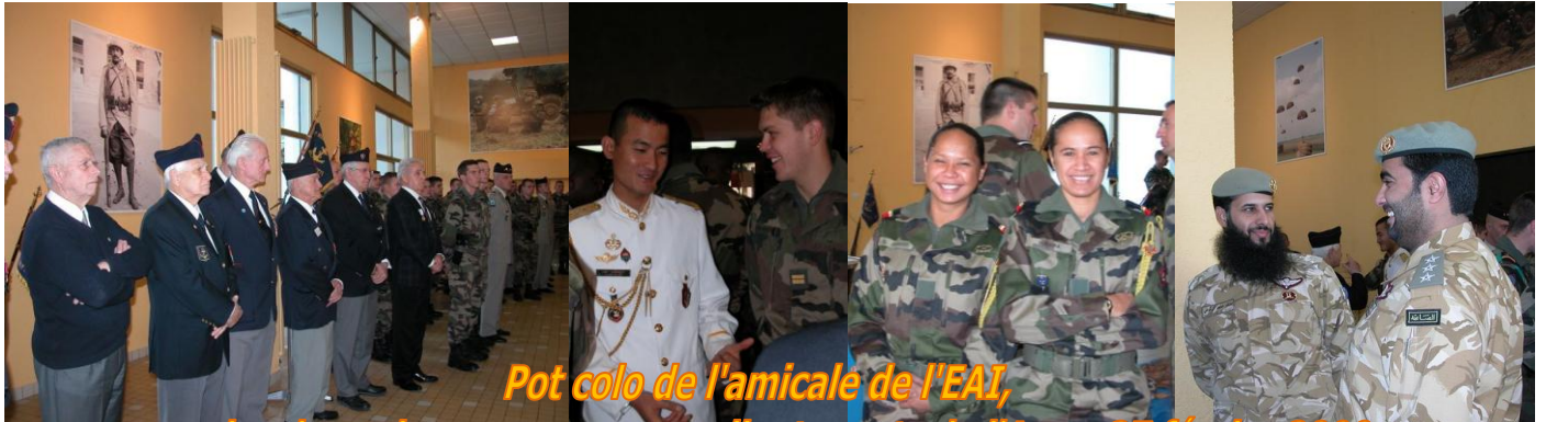
Pot colo de l'amicale de l'EAI, remise des galons aux nouveaux lieutenants de l'Arme 27 février 2009