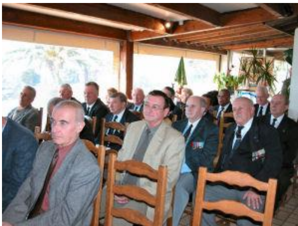
Une assemblée attentive