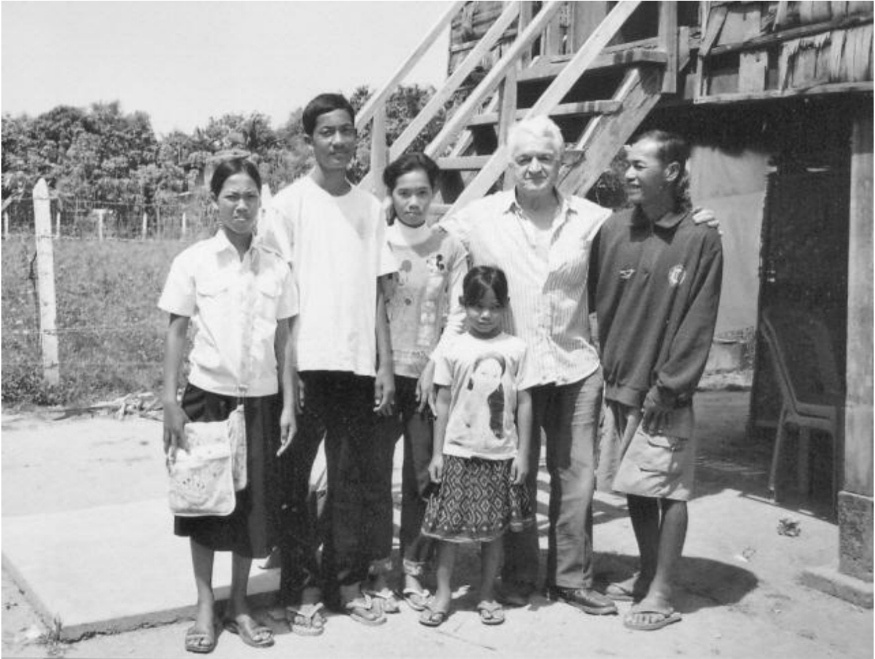
Avec la famille cambodgienne que je parraine