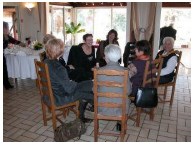
Les dames patientent en devisant